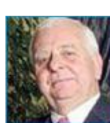
Eduardo Catroga Chairman da SAPEC Ministro das Finanças do XII Governo Constitucional