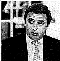
Manuel de Lancastre , empresário e vice-presidente do PSD.